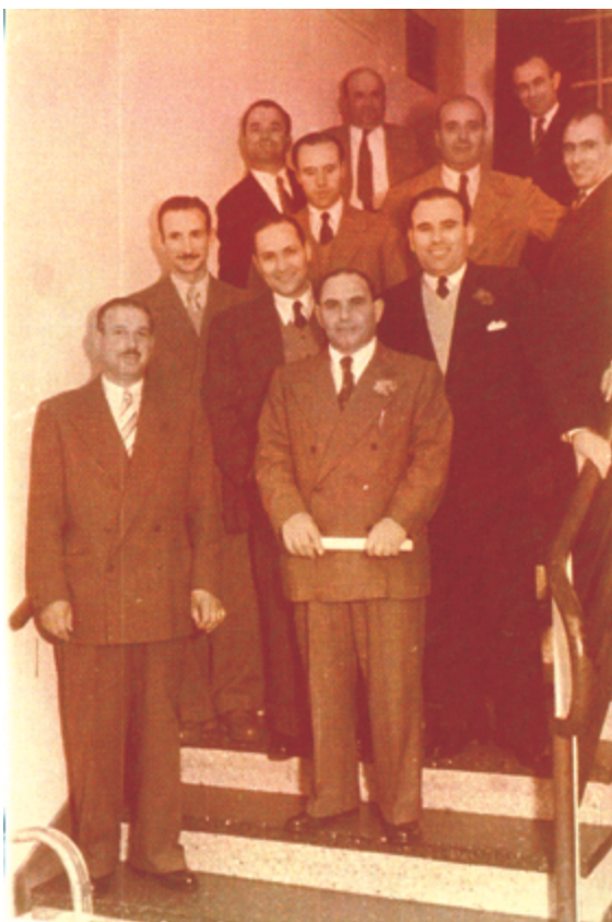
(Izda) Fotografía que retrata a la primera Comisión Directiva del Centro Región Leonesa de Mar del Plata (1950). (Abajo) Tres niños emigrantes en Mar del Plata posan mientras practican uno de los deportes más populares de la provincia, el bolo leonés (1951).