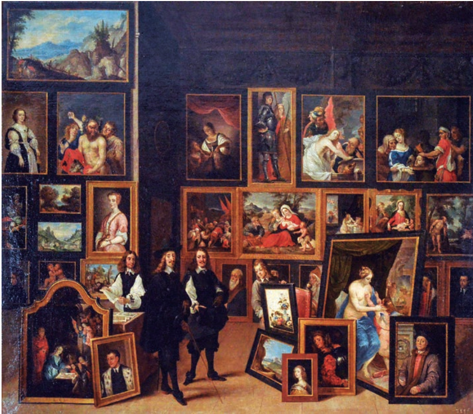
Fig. 2. The virtual gallery of Archduke Leopold Guillaume in Brussels , painting by David Teniers the Younger, around 1653; Madrid, Museo Lázaro Galdiano

as a miniature of the king of Persia with a gazelle. Other key pieces included various weaponry, numerous Ottoman artefacts, some sets of Japanese armour, and the collections of graphic arts and scientific instruments.