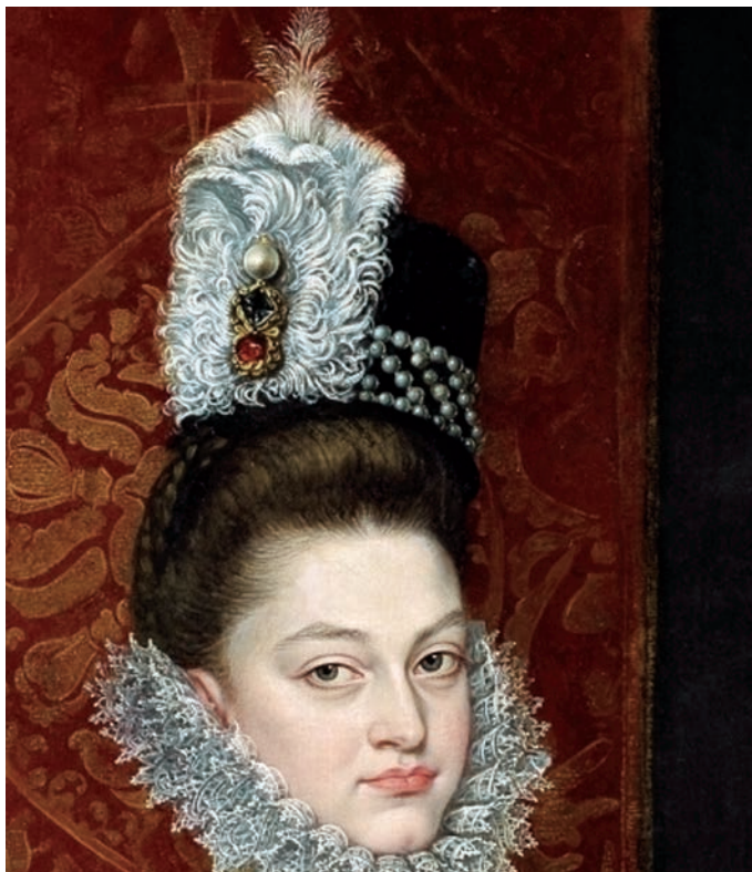
Fig. 1. El joyel es el que podemos observar en el retrato de Alonso Sánchez Coello de La Infanta Isabel Clara Eugenia y Magdalena Ruiz (detalle), 1585-1588. Madrid, Museo del Prado.

aspecto que nos gustaría tratar. En concreto, el papel de las infantas en este universo material y la conexión con dos figuras fundamentales: la propia Ana de Austria e Isabel de Valois.