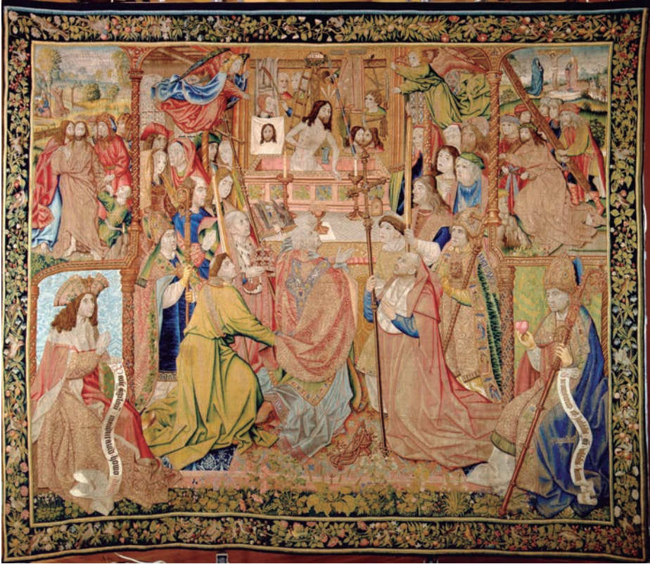
1. Sacramentum est invisibilis gratie visibilis forma . Pieter van Aelst, Misa de San Gregorio . Tapiz, oro, plata, seda y lana, 3,42 x 4,07 m. Bruselas, c. 1500. Colección de Isabel la Católica y Juana de Castilla. Museo de Tapices de La Granja de San Ildefonso, Segovia. Patrimonio Nacional, cat. TA-7/2, inv. 10005810.

de la reina Sancho de Paredes, en la villa de Alcalá de Henares, de manos de Hernán Núñez Coronel, y fue asentado en su libro como