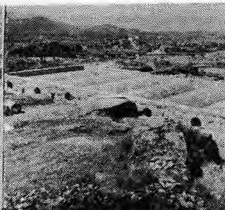
DEPOSITO DISTRIBUIDOR. —Este depósito en cola de la distribución con sus 500 metros cúbicos de capacidad asegura una dotación suficiente para las necesidades de Famoselle. En esta página puede verse ya terminado y en varias fases de su construcción. Las dos fotos interiores corresponden al detalle de una bóveda y al abovedado que cubre el depósito.

1952. Depósito distribuidor y vista de las obras. Abastecimiento de aguas de Famoselle. Memoria.