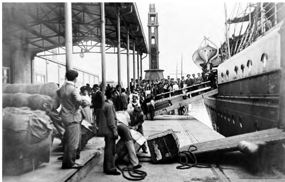
Hacia 1920. Llegada de emigrantes al puerto de Buenos Aires.

(25.458), en ese orden. En conjunto, las tres provincias sumaron un total de 92.340 individuos entre 1911 y 1929, representando el 49,5% del total de los emigrantes castellanos y leoneses para ese mismo periodo, y el 71,2% de los movilizados hacia Argentina. Por su parte, aquellos procedentes de Zamora con destino a Argentina representaron el 19,6% de los castellanos y leoneses, justificando de este modo el importante vínculo existente entre la provincia zamorana y el país argentino, lo que perdura hasta la actualidad.