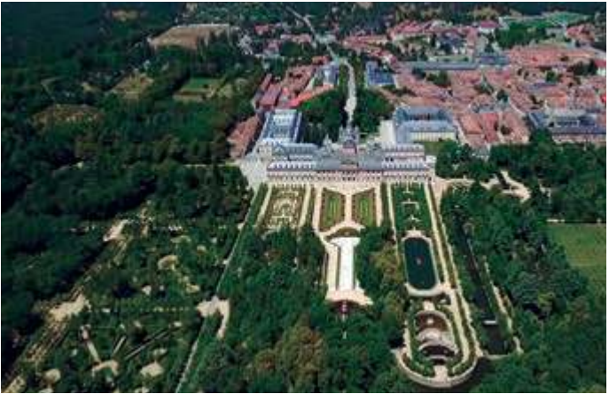
Vista aérea de los jardines del Rey

El Palacio Real de San Ildefonso cuenta con una superficie natural y cercada de 146 h. La constitución un jardín que completara la residencia de Felipe V en el momento de su abdicación fue uno de los objetivos esenciales en la creación del Real Sitio. Uno de los errores tradicionales ha sido asociar la traza del jardín del Real Sitio de San Ildefonso con la establecida en Versalles, cuando claramente no fue así. El paisaje del Palacio Real de San Ildefonso, al contar con la presencia de la sierra de Guadarrama como escenario, se aleja de todos los cánones establecidos para los jardines barrocos al uso trazados en la Europa del siglo XVIII. Sin duda, la singularidad que aporta el cierre de la sierra hace único este espacio y lo convierte en modelo y referente más que en copia o trasunto de otros jardines. Aún así, la traza general del paisaje vegetal tiene más en común con el desaparecido jardín del Château de Marly-le-Roi que con el archiconocido de Versalles.