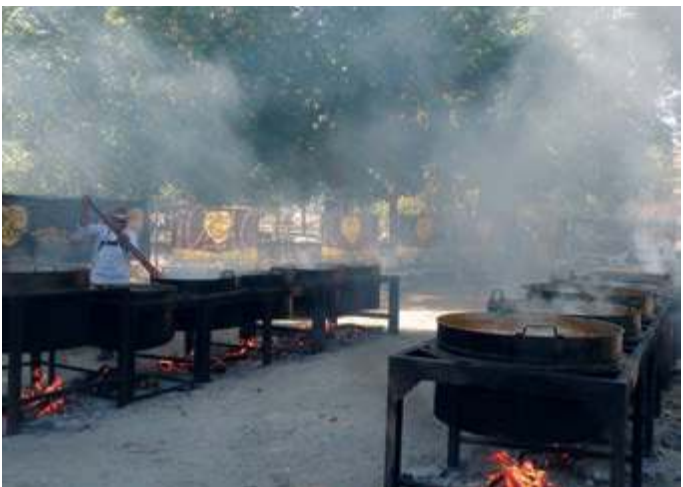
Calderos en la Gran Judiada

El 25 de agosto se celebra la fiesta del otro patrón, en este caso de La Granja de San Ildefonso, San Luis Rey de Francia, festividad asociada a la monarquía borbónica instalada en el Paraíso desde 1721. Ese día de Fiesta Mayor se acompaña con una semana de celebraciones, las Fiestas de San Luis, que paralizan la vida laboral del Real Sitio y atraen a multitud de visitantes deseosos de disfrutar de las verbenas, festejos taurinos y verbenas nocturnas, pero, sobre todo, de los Juegos de Agua de las Fuentes Monumentales, gratuitos el 25 de agosto, y de la Gran Judiada, comida de hermandad, organizada por el Excmo. Ayuntamiento y asociaciones varias en la Pradera del Hospital. También es digno de mencionar el tradicional concierto de San Luis en el Corro de La chata, dentro del Real Parque y Jardines del Palacio Real, ofrecido los últimos años por la Banda Municipal de El Espinar.