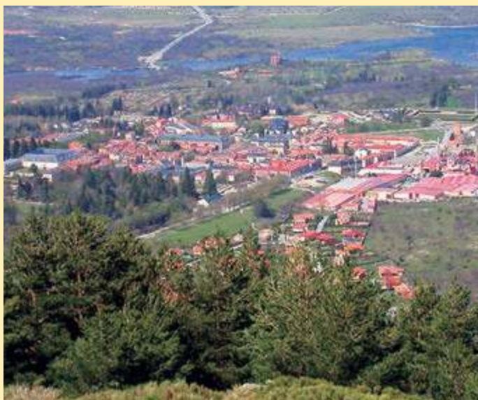
Vista general del Real Sitio de San Ildefonso

El término municipal del Real Sitio comprende 144,81 km 2 y alberga una población compuesta por aproximadamente 5.500 habitantes empadronados que pueden fluctuar hasta los 20.000 en periodos vacacionales. En lo que se refiere al núcleo de población, está compuesto por cuatro asentamientos principales, a saber: La Granja de San Ildefonso, núcleo principal con más de 4.500 vecinos registrados; Valsaín, con cerca de 200; La Pradera de Navalhorno, con 700 vecinos aproximadamente y Riofrío, con una decena de habitantes censados. Desde el punto de vista administrativo, El Real Sitio de San Ildefonso está compuesto por dos distritos básicos: La Granja de San Ildefonso y Valsaín, los Reales Sitios básicos, más el anejo de Riofrío.