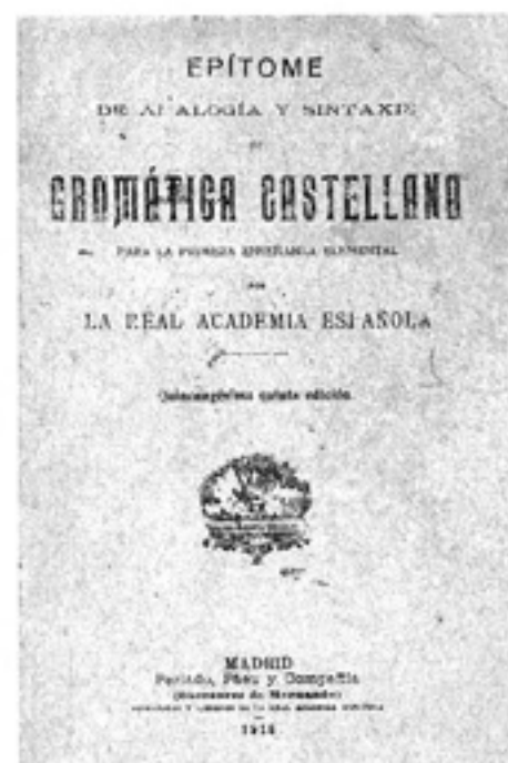
Textos escolares utilizados en Aranjuez