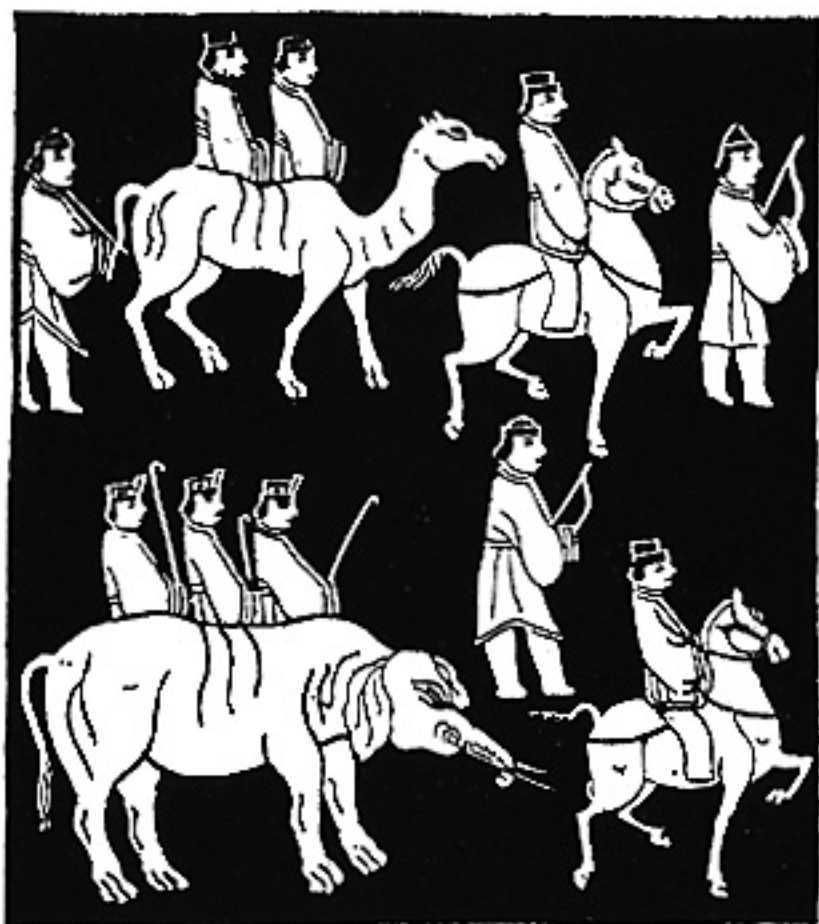
Pergamino chino estampado en piedra (siglo II a. de J. C.)