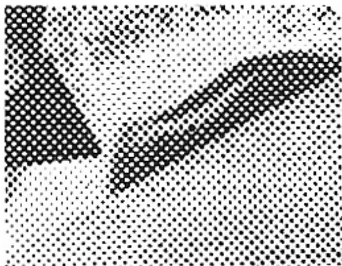
Ejemplos de un negativo de fotograbado directo y de su prueba impresa.