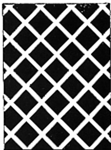
b) Trama para el láser grabado, y su negativo fotográfico.