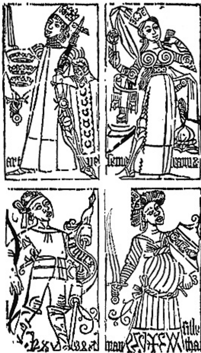
Juego de cartas de baraja grabadas en madera con cuchillo (siglo XV), a semejanza oriental.