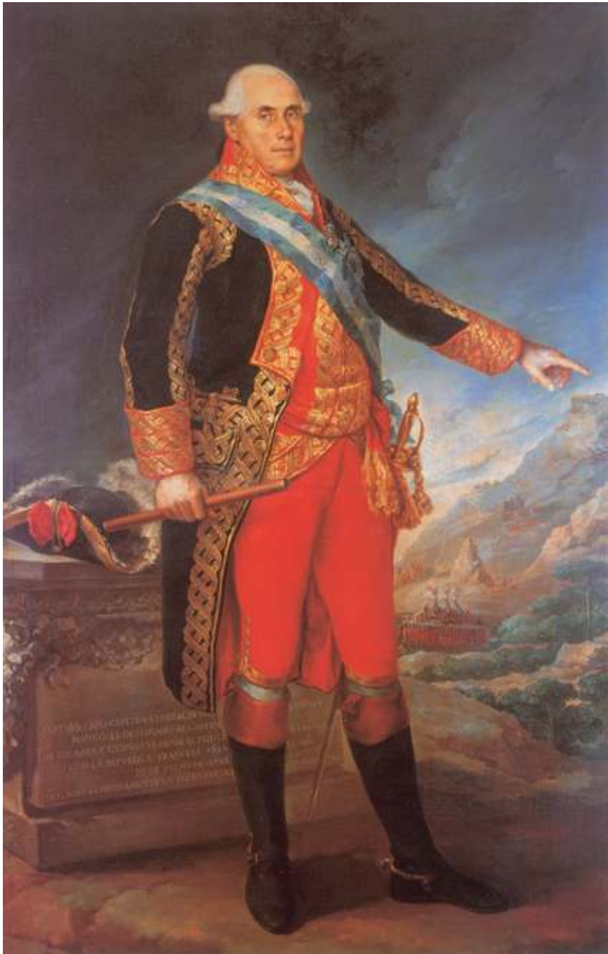
Vicente López Portaña. Ventura Caro, Capitán General de Valencia, ca. 1799. Valencia, Colección particular