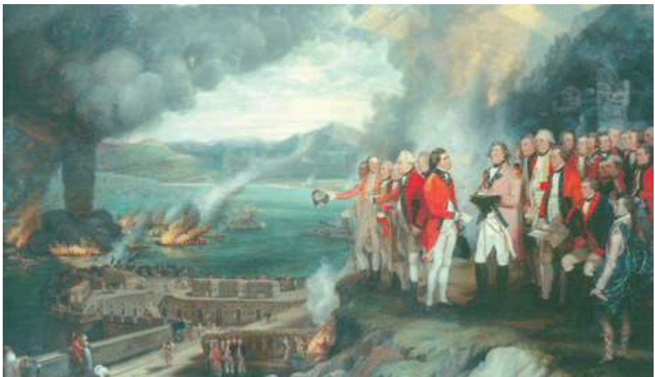
Georg Carter. General Eliot y las baterías flotantes frente a Gibraltar, 1782. National Army Museum