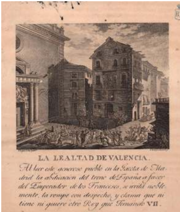
Vicente López. Lealtad de Valencia. Tomás López Enguádanos lo g.º, 1808. Madrid, Biblioteca Nacional