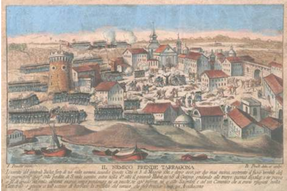
Bartolomeo Pinelli. El enemigo toma Tarragona, 3 de mayo de 1811