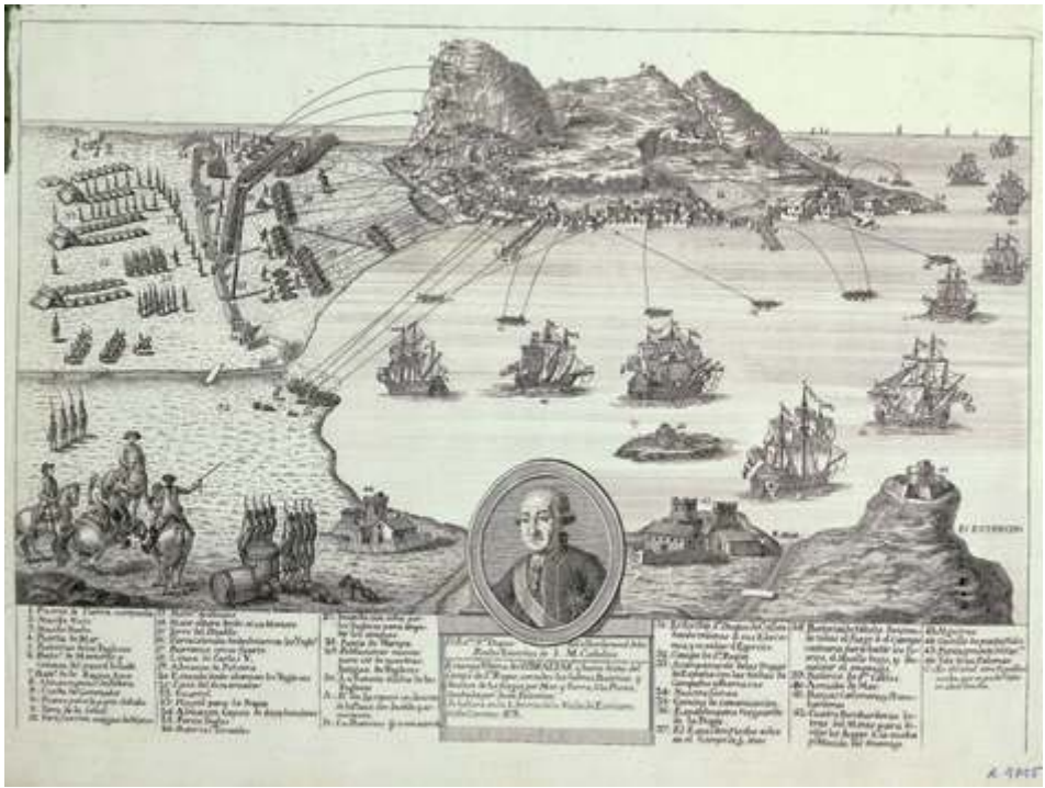
Juan Palomino. Estampa ultima de Gibraltar y buena vista del Campo de San Roque, con todas las obras, Baterías y dirección de los fuegos por mar y tierra a la Plaza. Madrid, Biblioteca Nacional