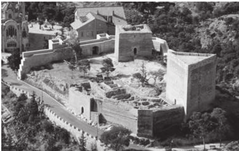
Vista aérea del castillo de La Mola en Novelda

que Pedro de Maza de Lizana, Almirante de Aragón y señor de Mogente, compra el castillo a doña Violante de Bar, esposa del rey Juan I el del Punyalet (1387-1395).