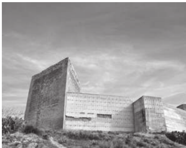
Castillo de La Mola en Novelda