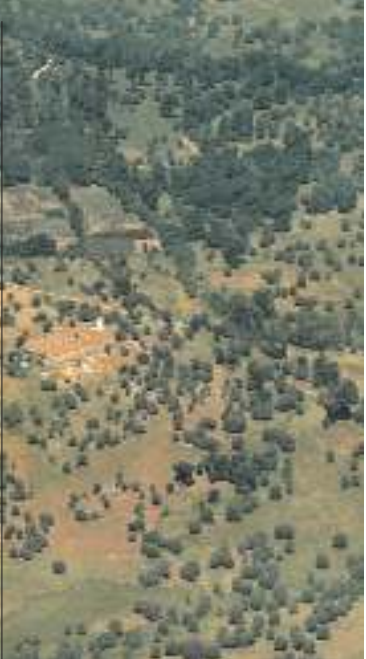
ESTANQUE DE LA ISLA